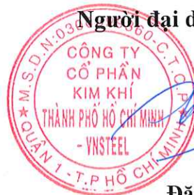
Đặng Huy Hiệp